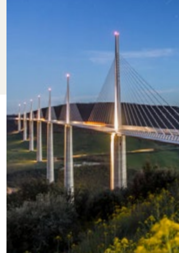
© Eiffage CEVM - Foster Partners - Greg Alric

Viaduc Expo - ☎ 05 65 61 61 54 ou ✉ viaduc.info@eiffage.com www.leviaducdemillau.com