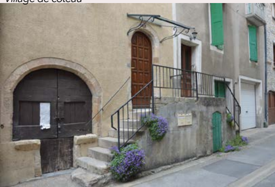
Village de vallée