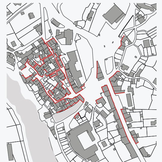
Exemple de périmètre d'intervention

Un périmètre est établi en fonction de l'intérêt urbain et architectural des lieux. Les façades doivent être vues du domaine public.