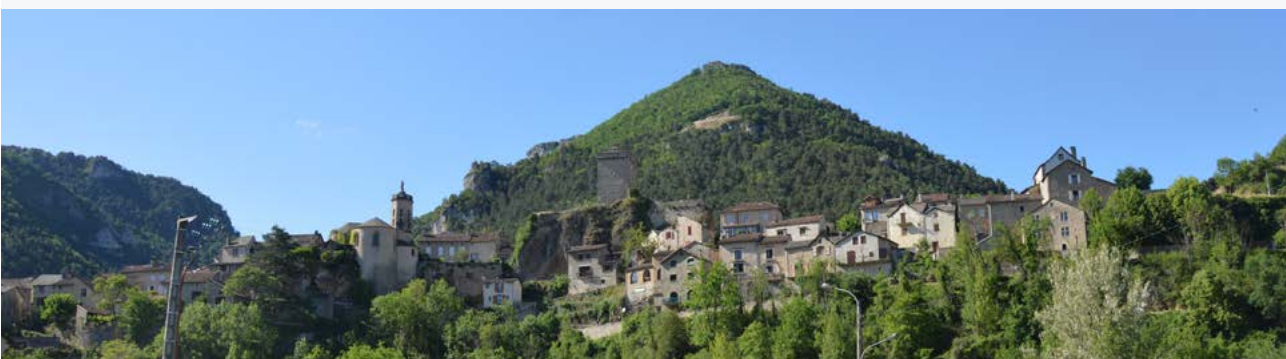
Village en éperon - Peyreleau

05 65 61 40 20 jerenovemafacade@cc-millaugrandscausses.fr