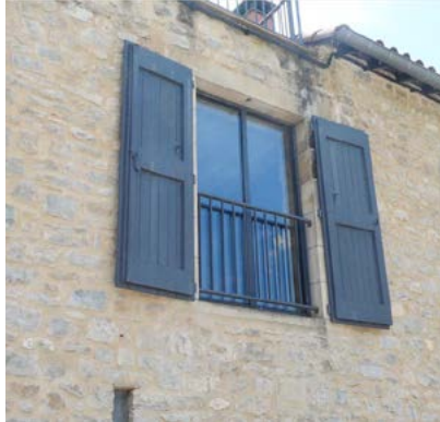
Restauration des joints