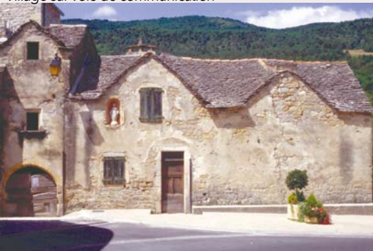
Village de causse