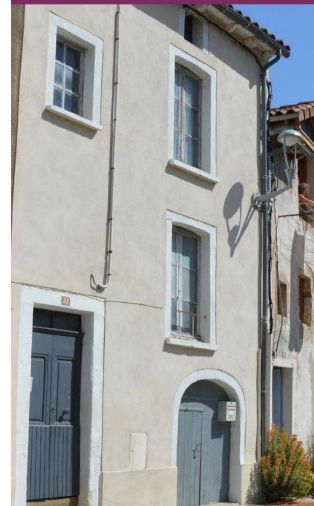
Restauration de façade

Des interventions partielles mais soignées, sont parfois suffisantes. Un entretien régulier ravive une façade à moindre frais. Un badigeon sur un enduit existant, une peinture sur une devanture en bois, évitent de reprendre en totalité des travaux coûteux. Ces interventions parfois modestes, assurent l'urbanité des façades et la pérennité d'un patrimoine de qualité.