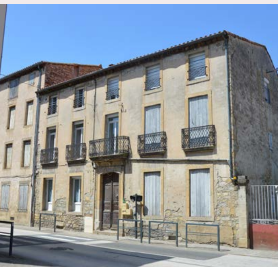
Village sur voie de communication