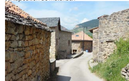
Retrait de l'enduit