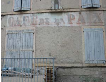
Ancienne enseigne peinte

L'enduit est à la fois la peau de l'édifice et son décor. En règle générale, les habitations constituées de moellons médiocres et irréguliers étaient recouvertes d'un enduit.