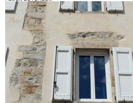
Incohérence du dressage de l'enduit