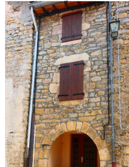
Jointes ciments et menuiseries «ton bois»