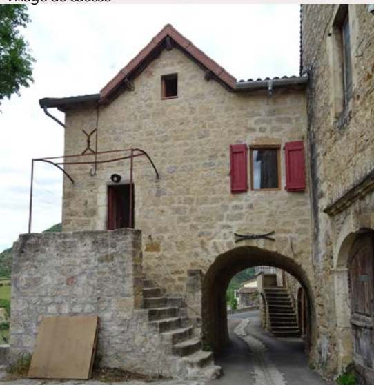
Village de coteau