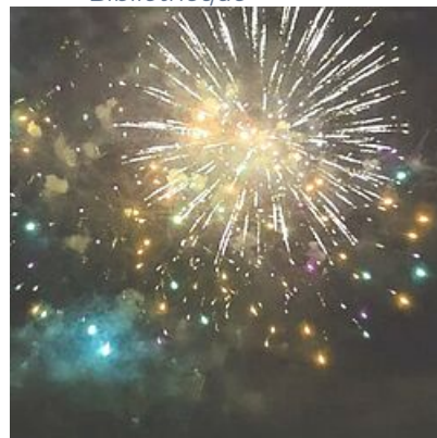
Feu du 14 juillet