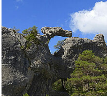
Le Parc naturel régional des Grands Causses