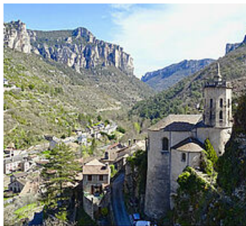
Notre Dame de Mirabels