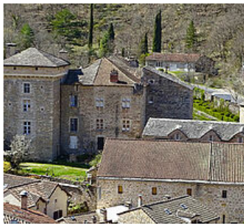
Le Château du Triadou