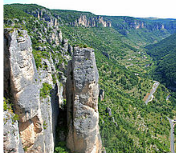
Les gorges du Tarn et de la Jonte