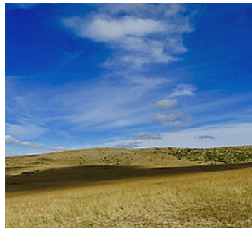
Le parc national des Cévennes