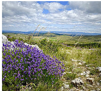
Les Causses et les Cévennes

id=com.reoviz.parcgrandscausses&hl=fr&gl=US )